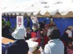
たご焼き出店（産業祭にて）