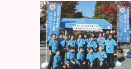
全国の女性部員をおもてなし