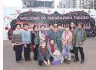
親睦旅行（宝塚歌劇）