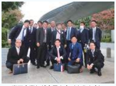
商工会青年部全国大会（広島大会）

たくさんの仲間を作りませんか？ 地域のネットワークをつなげませんか？ 異業種の人と情報を交換しませんか？ それを可能にするのが商工会青年部です。