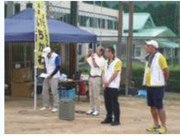
スナッグゴルフ大会