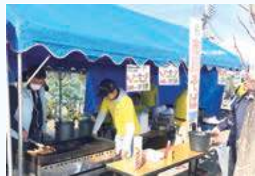
市川ソーセージの販売（産業祭にて）