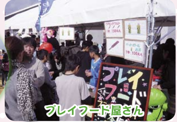
プレイフード屋さん