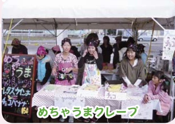
めちゃうまクレープ

今回で3回目となる“キッズあきんど”は、子どもたちが商店舗での販売従事などの体験を通して商売や各種職業を学ぶとともに、チャレンジ精神やコミュニケーション力などの向上に寄与することを目的として行っています。年々参加者も増えて、会場はにぎやかになっています。各店舗では、商品のPR、お店の宣伝など子どもたちで工夫して販売していました。“また来年も参加したいな”という子どもたちがたくさんいました。