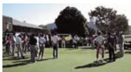
中・西播磨青年部ゴルフコンペ 市川町の地場産業や特産をPRしました

青年部は若手経営者や後継者が集まり、異業種の交流の中で親睦を深めながら、地域を元気にしようと活動しています。また町内だけでなく県内の部員とも交流が広がり、様々な経営の勉強も出来ます。昨年、本青年部は日頃の活動が認められ、全国商工会連合会会長より優良青年部表彰を受けました。今後は更に活動の幅を広げ、経営革新などにも取り組み、自分たちの商売も元気にしていきたいと思っています。是非、青年部活動に参加してください。