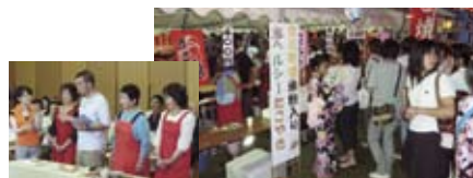
NHKで紹介された「米粉入りたこやき」の販売(市川まつりにて)

今年度、商工会女性部では元祖ハートの町市川町をPRするため、ハートの種(ふうせんがずらの種)入りストラップを作成し、交通安全街頭キャンペーンで配布を行ったり、誰でも参加できる身近な「エコ」及び「社会貢献」活動の一環として、ペットボトルのキャップ回収事業(「エコキャップ」回収事業)に取り組んだりしています。また、NHKで紹介しました「米粉入りたこやき」の販売も各イベントで行っております。次回は2月19日(日)の「第36回兵庫市川マラソン全国大会」で販売を行いますので、是非ご賞味下さい!!