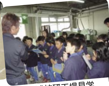
三浦技研工場見学