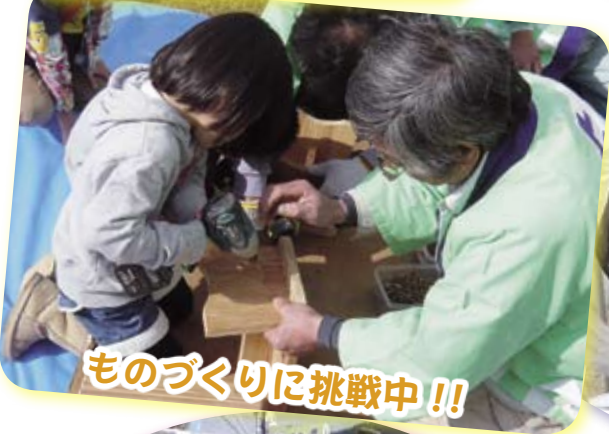
ものづくりに挑戦中!!