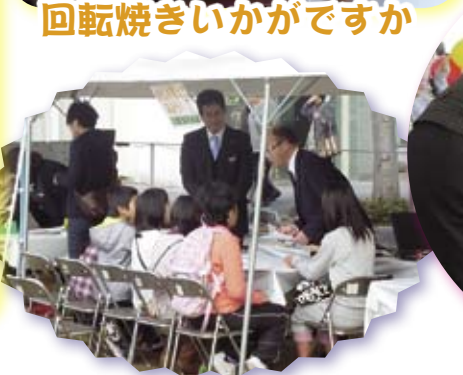
回転焼きいかがですか