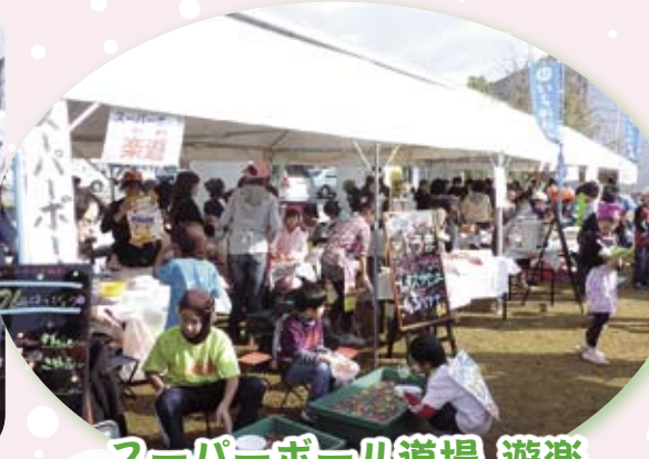
スーパーボール道場 遊楽