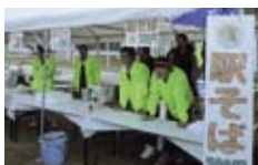
商工祭の駅そば販売