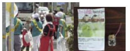
ハートの種入りストラップを交通安全街頭キャンペーンで配布(役場前交差点)