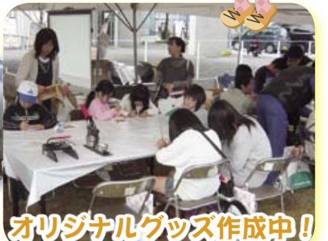
オリジナルグッズ作成中!