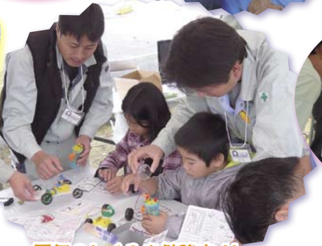
電気のしくみを勉強中!!