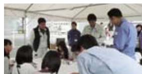
職業体験コーナーでは部員の事業所も参加、協力しました