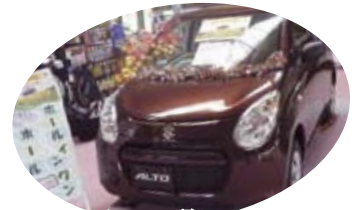
ホールインワン賞のスズキアルト 残念ながら今回はできませんでした