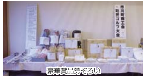
豪華賞品勢ぞろい

商工会では今後も秋にゴルフ大会を開催し、ゴルフクラブ発祥の地のPRに努めていきたいと考えております。