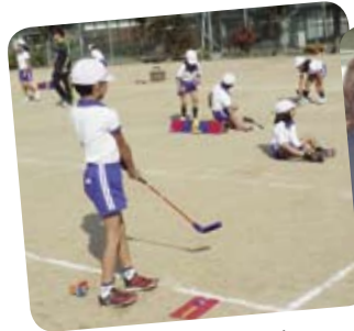
スナッグゴルフ体験