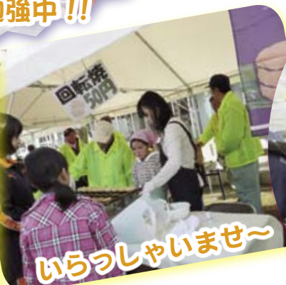
いらっしやいませ~