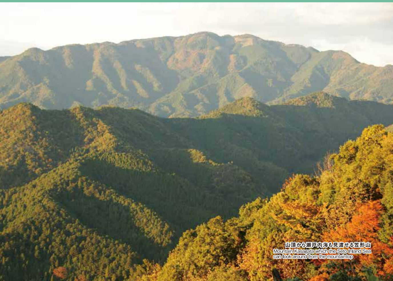
山頂から瀬戸内海も見渡せる笠形山 Mountain Kasagata which the Seto Inland Sea can look around from the mountaintop