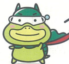
広報キャラクター「たしかめたん」