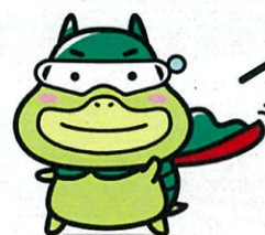
広報キャラクター「たしかめたん」